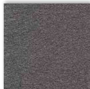
95 4m + 5m