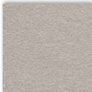
09 4m + 5m