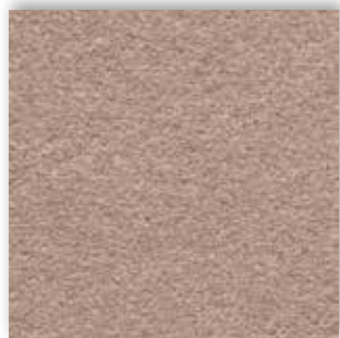
36 4m + 5m