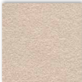
30 4m + 5m