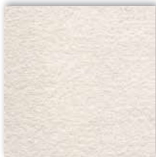
03 4m + 5m