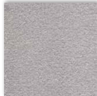
90 4m + 5m