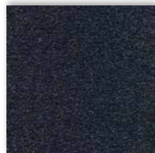
78 4m + 5m

La société Associated Weavers se réserve le droit de modifier les caractéristiques de ce produit tout en conservant les mêmes qualités techniques. Il est fortement conseillé d'utiliser les coloris moyens et foncés pour les pièces à grand trafic.