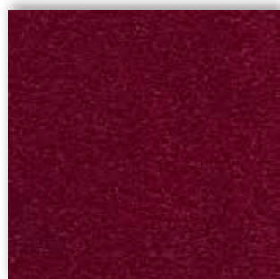
10 4m + 5m