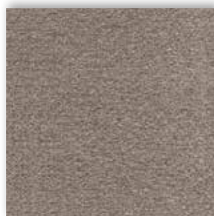
39 4m + 5m