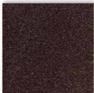
45 4m + 5m