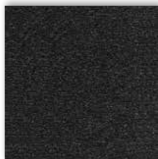
98 4m + 5m