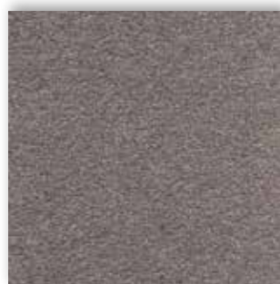
94 4m + 5m