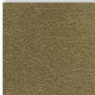
20 4m + 5m