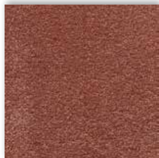
80 4m + 5m