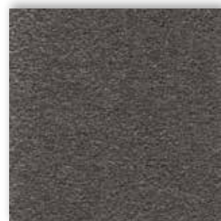
97 4m + 5m