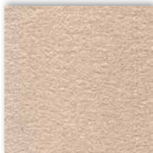
33 4m + 5m