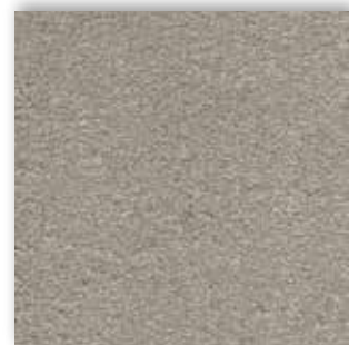
29 4m + 5m