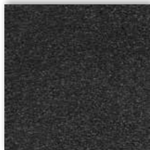
98 4m + 5m