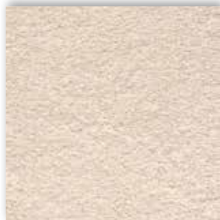
30 4m + 5m