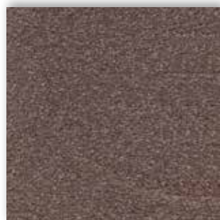
40 4m + 5m