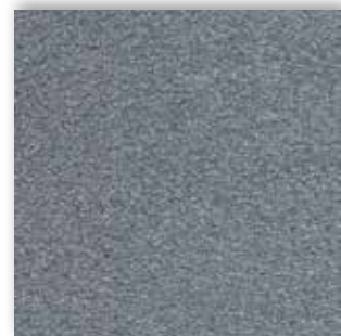
70 4m + 5m