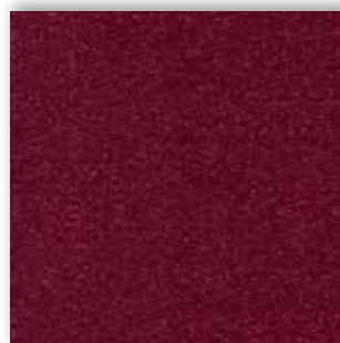
10 4m + 5m