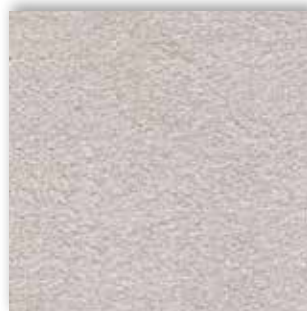
90 4m + 5m