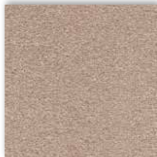
36 4m + 5m