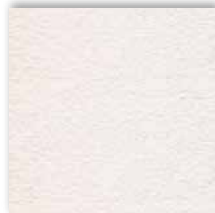
03 4m + 5m

La société Associated Weavers se réserve le droit de modifier les caractéristiques de ce produit tout en conservant les mêmes qualités techniques. Il est fortement conseillé d'utiliser les coloris moyens et foncés pour les pièces à grand trafic.