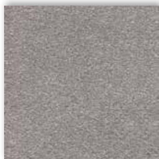
95 4m + 5m