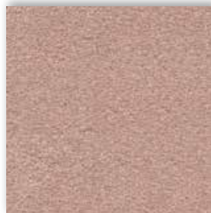
38 4m + 5m