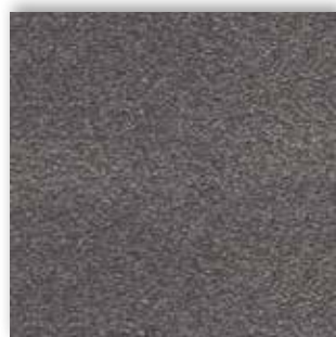
97 4m + 5m