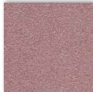
60 4m + 5m