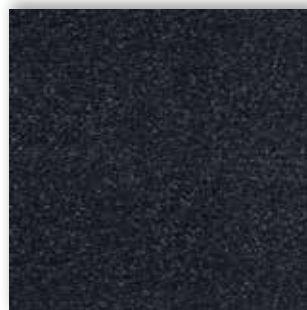
78 4m + 5m